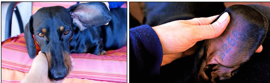
Rys. 2, 3. Umiejscowienie tatuażu identyfikującego na przykładzie psa