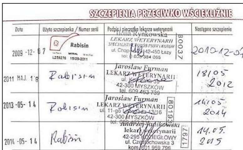
Rys. 7. Potwierdzenie szczepienia przeciwko wściekliźnie