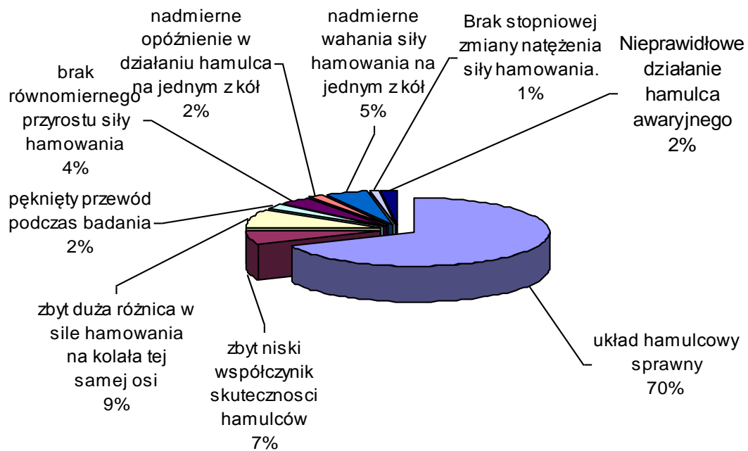
Rys. 1. Wyniki badania układów hamulcowych