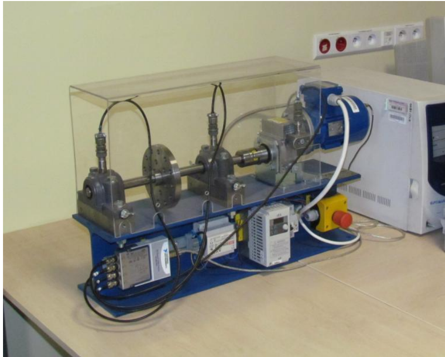
Rys. 2. Stanowisko pomiarowe VibStand

Obiektem rzeczywistym wykorzystanym do praktycznego potwierdzenia możliwości badawczych opracowanego, modułowego systemu pomiarowo-kontrolnego było stanowisko badawcze VibStand, którego widok ogólny przedstawiono na rys. 2.