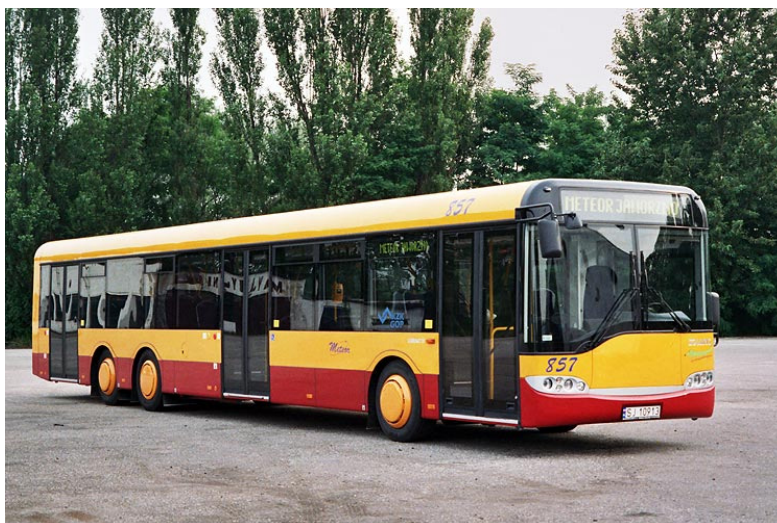
Rys. 1. Autobus Solaris Urbino 15 nr tab. 857 w barwach firmy Meteor Jaworzno (żółto-bordowy)

kolorystyki poprzednich właścicieli pojazdów), tramwaje pozostały przy tradycyjnych barwach kremowo-czerwonych, odziedziczonych po WPK Katowice (choć też z wyjątkiem, gdyż wagony 116Nd zakupione w latach 2000-2001 pomalowane są na szaro). Podobna sytuacja występuje w MZK Tychy, pomimo dużo mniejszej liczby przewoźników.