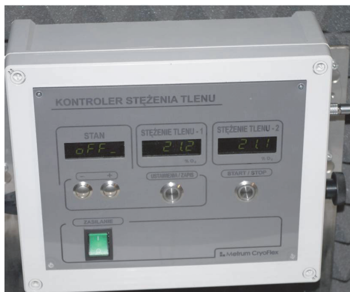
Rys. 2. Modułowy kontroler stężenia tlenu Fig. 2. The modular oxygen controller

Modułowy kontroler stężenia tlenu sygnalizuje również przekroczenia zadanych wartości granicznych (dolnej i górnej, ustalanych dla obu czujników). Alarm dźwiękowy jest uruchamiany wskutek wykazania przekroczeń przez oba czujniki; zarejestrowanie przekroczenia tylko jednym czujnikiem skutkuje miganiem odpowiedniego wyświetlacza.