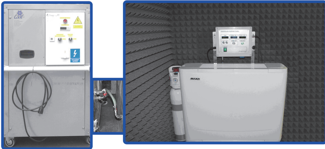
Rys. 6. Główne moduły systemu zapewnienia komfortu Fig. 6. Main modules of the comfort providing system