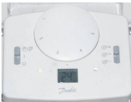
Rys. 4. Wewnętrzny regulator temperatury powietrza Fig. 4. The internal air temperature controller

Termokonwektor wewnętrzny utrzymuje temperaturę powietrza i współpracuje z zespołem zapewniającym właściwy skład powietrza w pomieszczeniu. Wewnętrzny regulator temperatury (rys. 4) przełącza zawór sterujący przepływem schłodzonego glikolu przez wymiennik ciepła stosownie do temperatury wewnątrz pomieszczenia oraz reguluje wydatek wentylatora powietrza. Termoregulator umieszczono w bloku wewnętrznego wymiennika ciepła obok wylotu powietrza; takie umiejscowienie regulatora okazało się optymalne dla zapewnienia właściwej reakcji na zmiany termiczne.