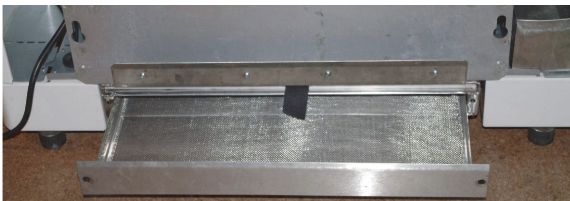
Rys. 5. Pojemnik absorbera dwutlenku węgla Fig. 5. The container of carbon dioxide absorber

Początkowo do badań nad prototypem kabiny wykorzystano autonomiczne przenośne pochłaniacze przeznaczone do szybkiego usuwania dwutlenku węgla z zamkniętych pomieszczeń, dostępne pod nazwą handlową CASPA. Finalnie opracowano rozwiązanie wykorzystujące wewnętrzny wymiennik ciepła: wymuszono przepływ powietrza chłodzonego w wymienniku przez pojemnik wypełniony granulami substancji wiążącej dwutlenek węgla. Pojemnik na granulki zabudowano pod wlotem powietrza w podstawie wymiennika (rys. 5), bezpośrednio nad elektrochemicznymi czujnikami tlenu.