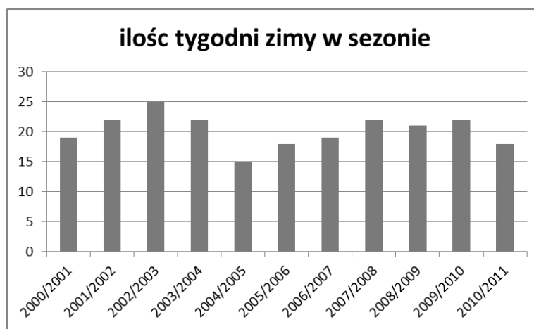
Rys. 1. Czas trwania zimy w poszczególnych sezonach zimowych